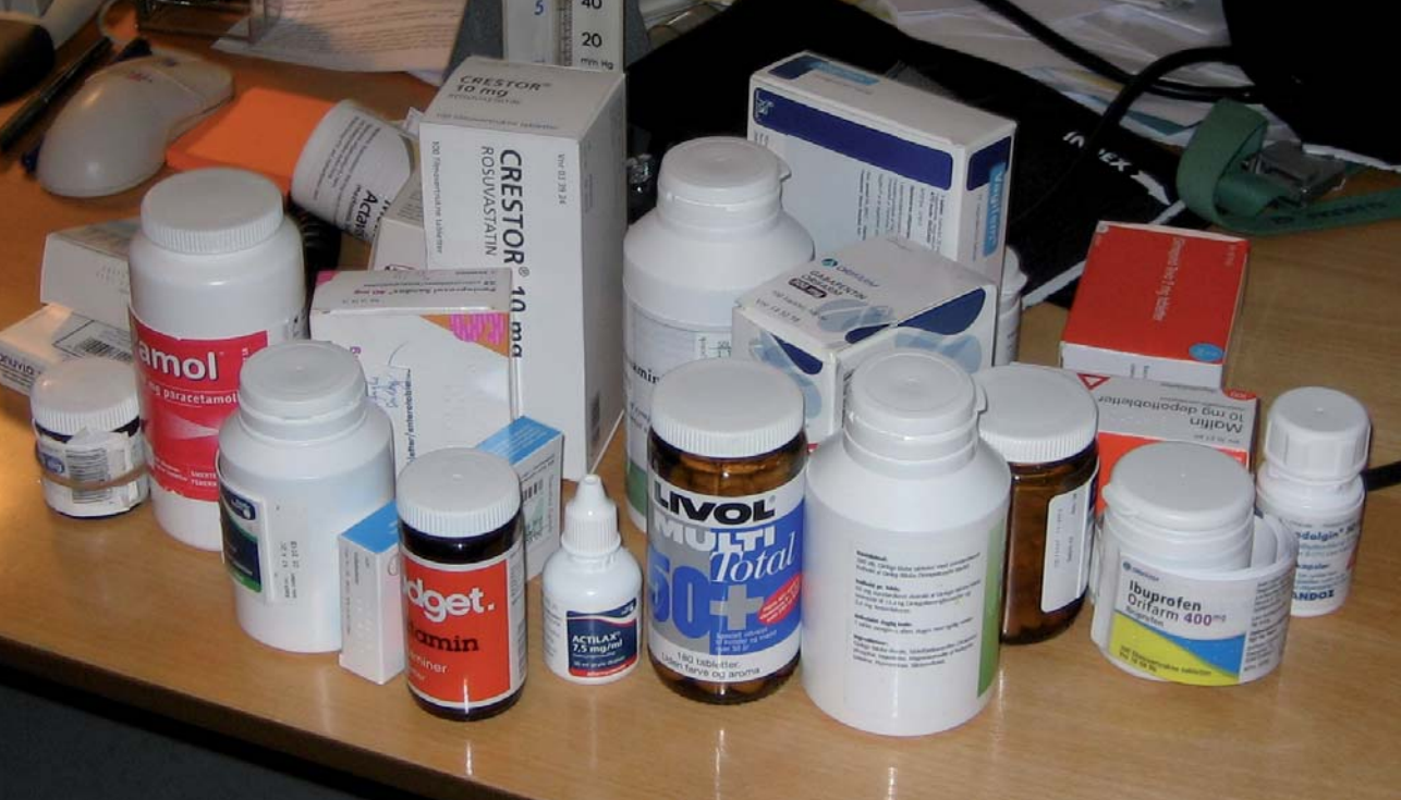
Figur 2 / Målgruppen for medicingennemgang er patienter, som får mange lægemidler for flere forskellige sygdomme.

cinoverblik, journaldata og patientens tilstedeværelse. Ydelsen: forebyggende hjemmebesøg hos ældre bør foregå på dette niveau. I denne situation er der også mulighed for at monitorere mere uspecifikke bivirkninger såsom ændringer i kognition og mobilitet (1). Beslutninger om medicinændringer tages sammen med patienten. Pårørende eller evt. patientens primære plejeperson kan deltage, såfremt det er relevant.